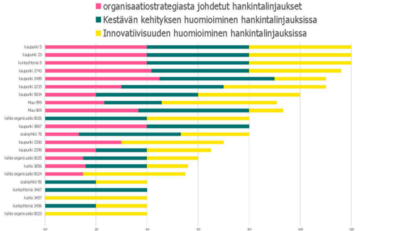
Itsearvioitu hankintatoimen maturiteetti KEINO-akatemiaan osallistuvissa organisaatioissa